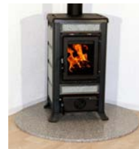
"Salt & Pepper"

Aktuelle Materialien, Formen und Preise sowie die Möglichkeit der bequemen Online-Bestellung finden Sie auf www.funkenschutzplatte24.de .