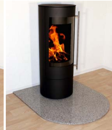
"Salt & Pepper"